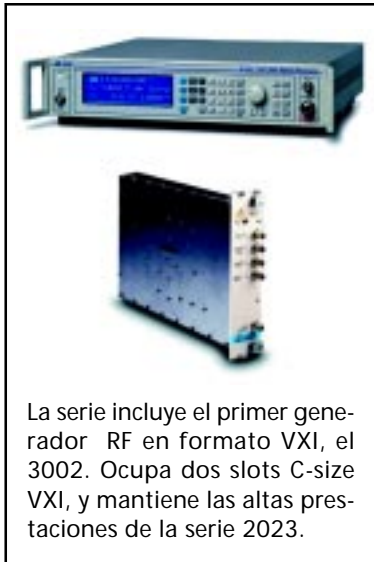
Figura 3. La serie 2023 acepta un amplio rango de aplicaciones en laboratorio, producción, servicio y mantenimiento.

La serie incluye el primer generador RF en formato VXI, el 3002. Ocupa dos slots C-size VXI, y mantiene las altas prestaciones de la serie 2023.