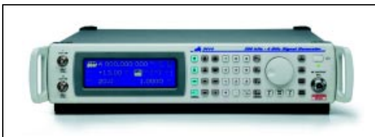
Figura 4. El generador 3414 (250 kHz a 4 GHz) combina modulación digital, vectorial y analógica en un formato 2U

Hasta ahora los generadores de RF utilizaban dos métodos de selección de los parámetros principales. El primero consiste en teclas dedicadas que al ser pulsadas hacían aparecer una serie de teclas soft en pantalla. El otro método consiste en el uso exclusivo de teclas soft que al ser pulsadas provocan el cambio de opciones en ellas, la pantalla se utiliza para mostrar los textos de las fun-