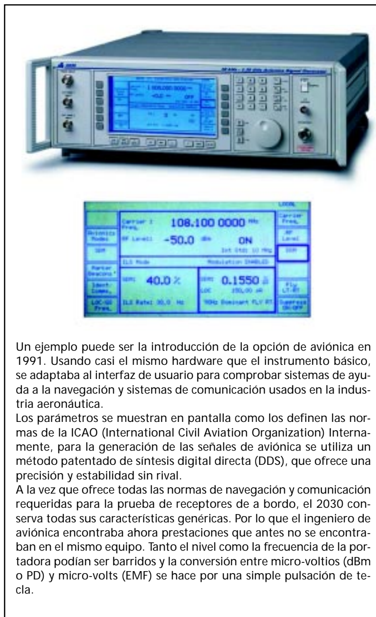
Figura 2. La combinación de teclas soft y la pantalla LCD ofreció una buena solución a los problemas de configurar un instrumento de propósito general con aplicaciones específicas.

Un ejemplo puede ser la introducción de la opción de aviónica en 1991. Usando casi el mismo hardware que el instrumento básico, se adaptaba al interfaz de usuario para comprobar sistemas de ayuda a la navegación y sistemas de comunicación usados en la industria aeronáutica.