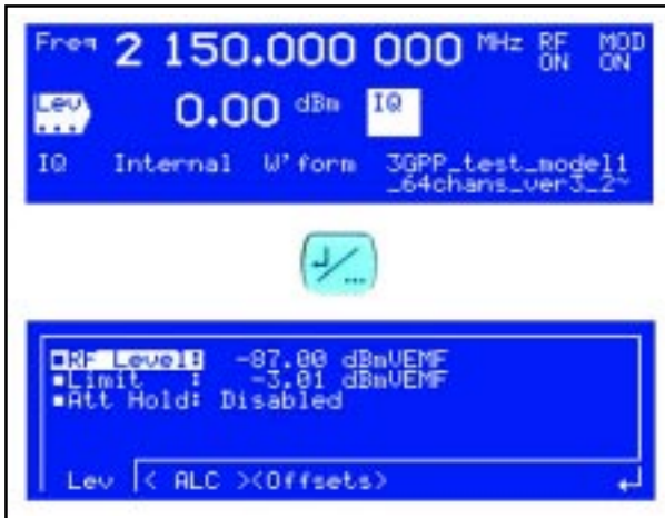
Figura 7. Las funciones de sub-menús contienen prestaciones avanzadas y controles adicionales para la mayoría de los parámetros del generador seleccionables