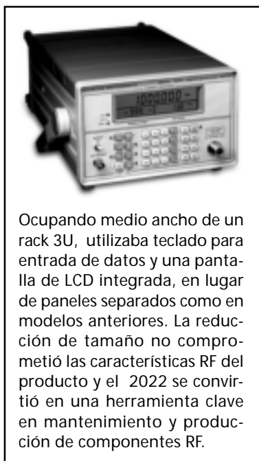
Figura 1. El 2022 usó las lecciones aprendidas en el desarrollo del 2018 para reducir el volumen y el costo de generadores controlados por microprocesador.

Ocupando medio ancho de un rack 3U, utilizaba teclado para entrada de datos y una pantalla de LCD integrada, en lugar de paneles separados como en modelos anteriores. La reducción de tamaño no comprometió las características RF del producto y el 2022 se convirtió en una herramienta clave en mantenimiento y producción de componentes RF.