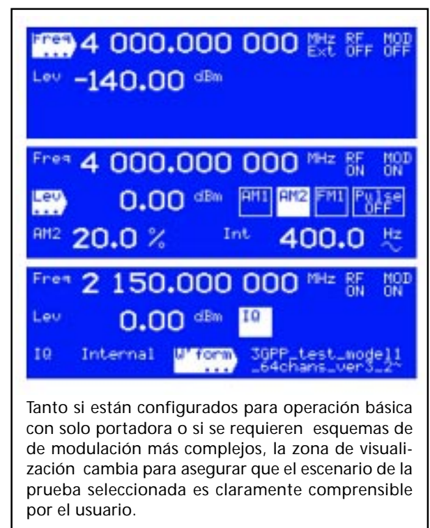
Figura 6. La serie 3410 elimina la necesidad de teclas de función dedicadas

Tanto si están configurados para operación básica con solo portadora o si se requieren esquemas de modulación más complejos, la zona de visualización cambia para asegurar que el escenario de la prueba seleccionada es claramente comprensible por el usuario.